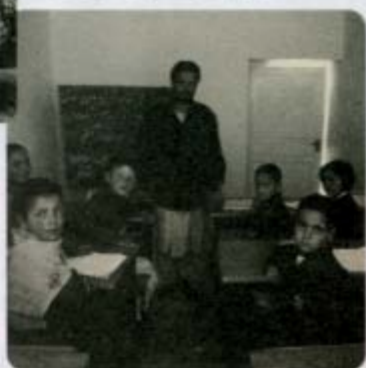
現在の教室の様子