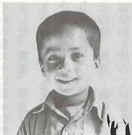
ゼケルラーくん（5歳）1年 好きなもの：車 将来の夢：先生