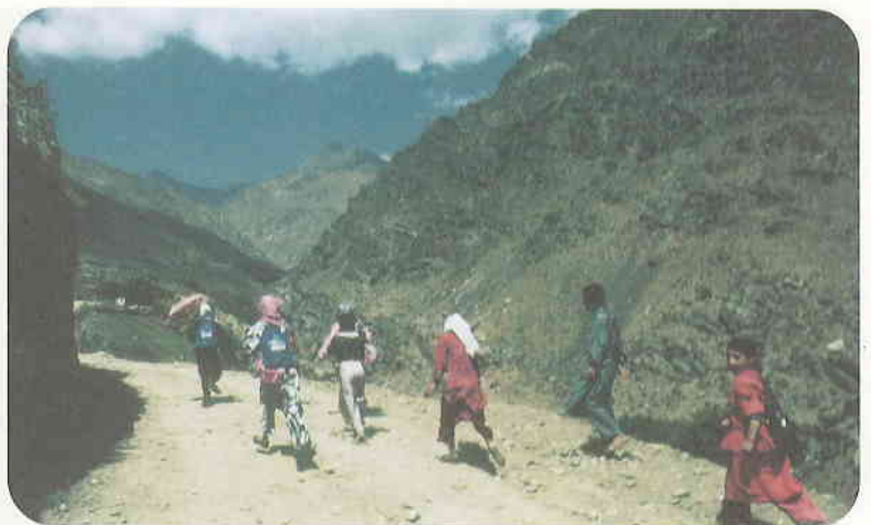
授業が終わり、家路につく子どもたち

「アフガニスタン 山の学校支援の会」は、写真家・長倉洋海が取材活動を通して出会った、パンシール渓谷ポーランド村の子どもたちの教育支援を目的として設立された非営利の団体です。2004年2月設立、以後10年間にわたり活動を続けていきます。